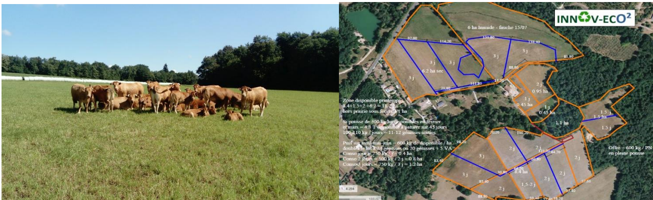
La Roche Chalais (24)

Le but est d'acquérir des compétences utiles pour une gestion optimisée et autonome des prairies et des couverts par le pâturage des animaux et de concevoir sur chaque exploitation un schéma/projet de Pâturage maximisé adapté à la situation du parcellaire et aux objectifs fixés par l'éleveur.