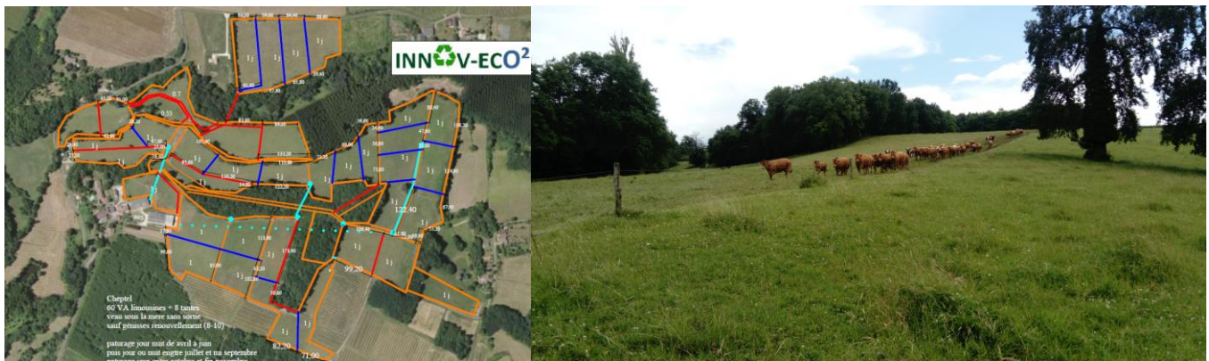
Landerrouet sur segur (33)

L'objectif est d'acquérir des connaissances utiles pour une gestion optimisée des prairies et des couverts par le pâturage des animaux et de concevoir sur chaque exploitation un schéma/projet de pâturage maximisé adapté à la situation du parcellaire et aux objectifs fixés par l'éleveur.