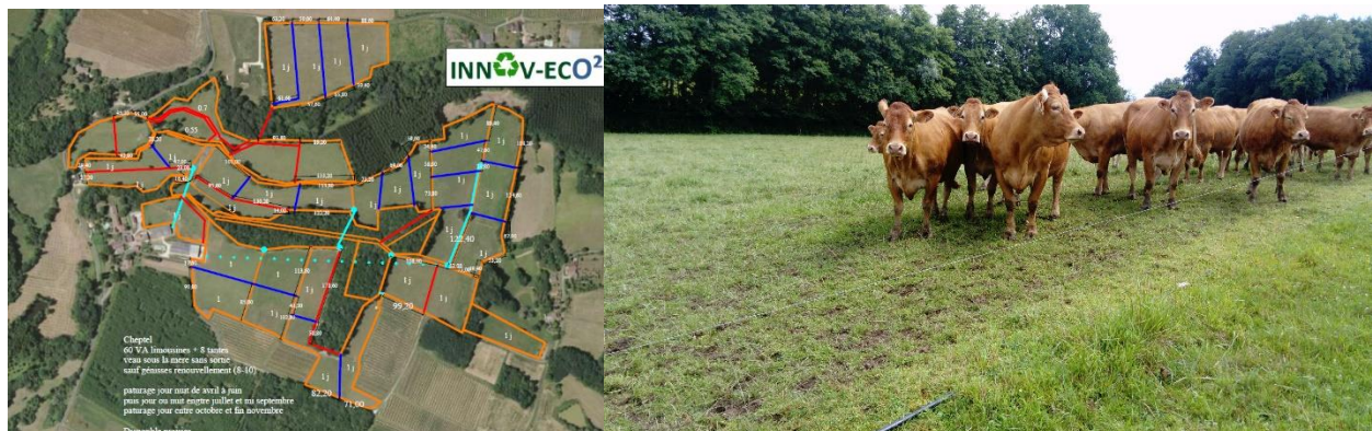
Landerrouet sur segur (33)

L'objectif est d'acquérir des connaissances utiles pour une gestion optimisée des prairies et des couverts par le pâturage des animaux et de concevoir sur chaque exploitation un schéma/projet de pâturage maximisé adapté à la situation du parcellaire et aux objectifs fixés par l'éleveur.